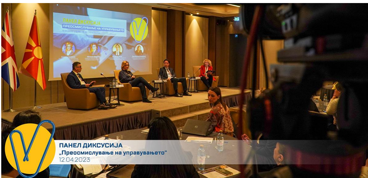
ПАНЕЛ ДИКСУСИЈА „Преосмислување на управувањето“ 12.04.2023

Во текот на 2023 година, проектот работеше на бројни активности на анализа на постоечките системи и предизвиците кои тие поставуваат, како и унапредување на релевантните процеси.